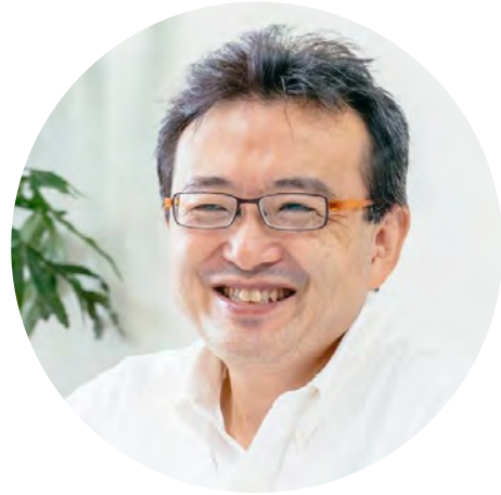
村上 敬亮 デジタル庁 統括官 兼 国民向けサービス グループグループ長