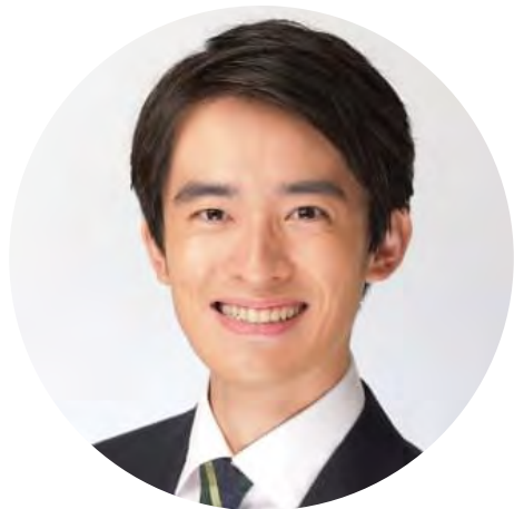
高島 峻輔 兵庫県芦屋市市長