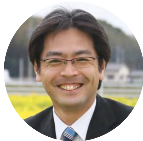
田辺 一城 福岡県古賀市市長