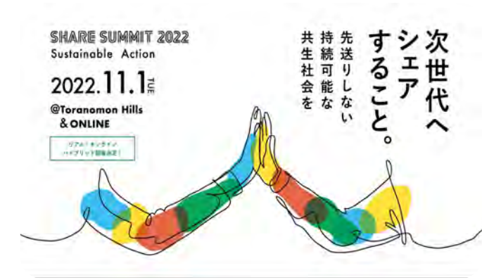
「次世代へシェアすること。」