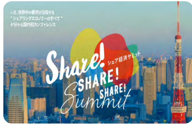
「Share ! Share ! Share!」