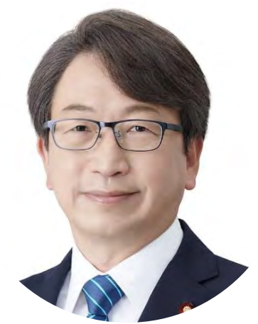
平 将明 衆議院議員／自民党広報本部長代理 デジタル社会推進本部長代理