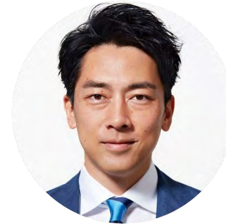
小泉 進次郎 衆議院議員 元環境大臣