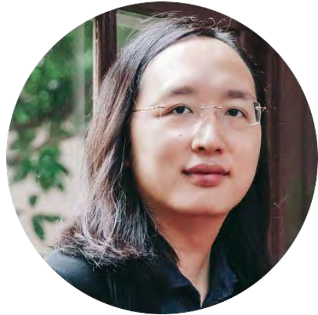
オードリー タン 台湾 デジタル担当大臣