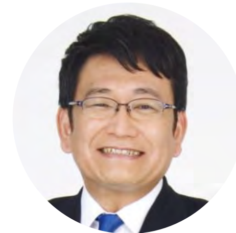
神谷 俊一 千葉県千葉市市長