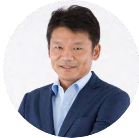
宮坂 学 東京都副知事