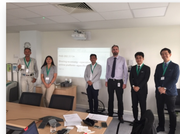
英国規格協会でのBS/PAS委員会