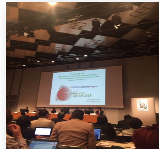
環太平洋標準会合@岡山